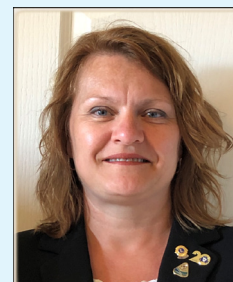
Promotrice des causes Lions District U4

Plusieurs petits gestes mènent à des changements : pensons-y!